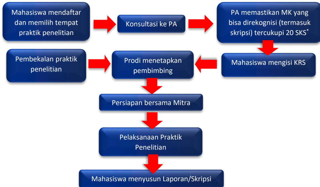
Gambar 3. Mekanisme Praktik Penelitian