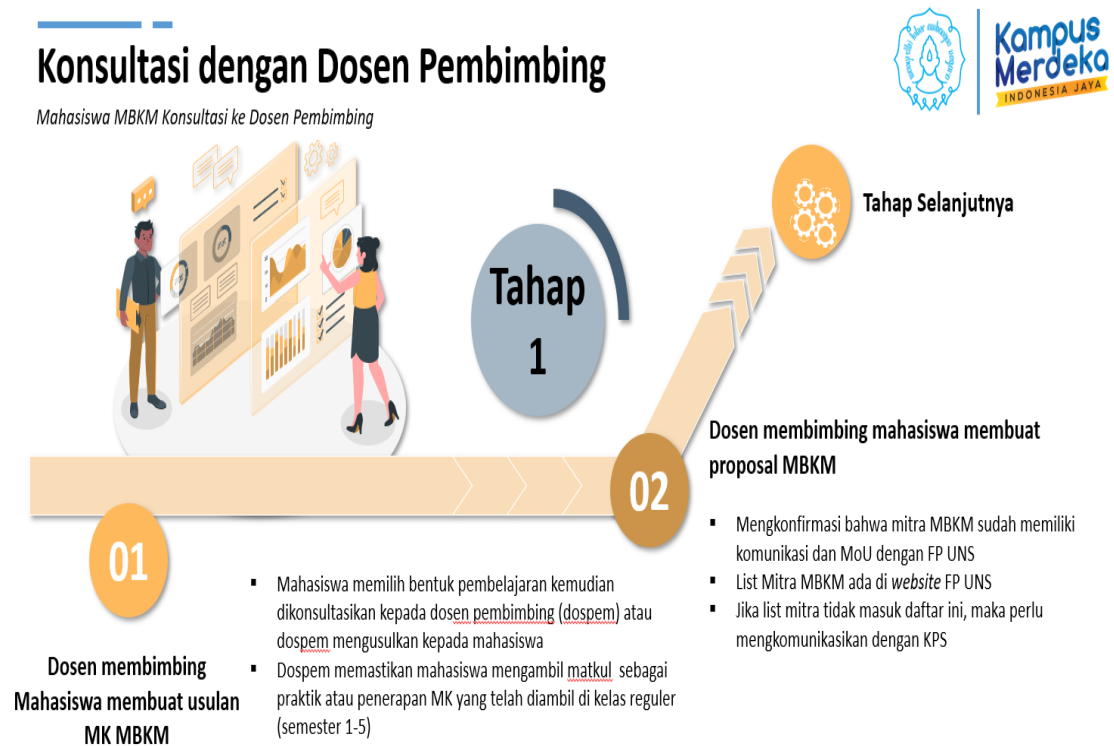
Gambar 2. Mekanisme konsultasi praktik penelitian

Adapun mekanisme konsultasi dan pembimbingan praktik penelitian dilakukan seperti halnya magang, yang mengikuti alur sebagaimana tersaji pada Gambar 2 dan 3 berikut: