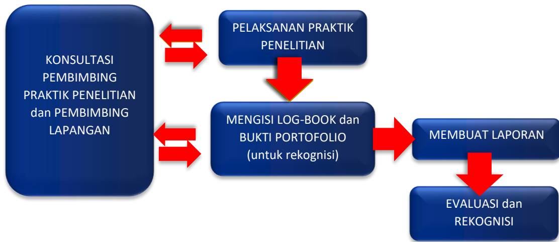
Gambar 4. Mekanisme pembimbingan praktik penelitian